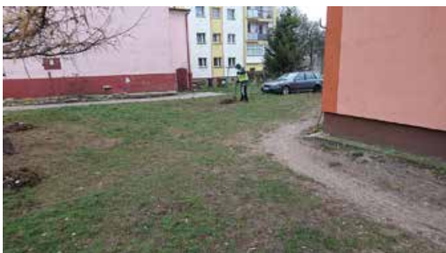
Ul. 5 Marca