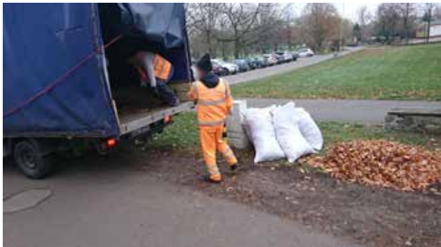
Plac Szarych Szeregów

Od ośmiu lat, na polecenie burmistrza Roberta Czapl, trwa projekt związany z systematycznym porządkowaniem naszej gminy. Prace wykonywane są przez osoby osadzone w nowogardzkim Zakładzie Karnym, stażystów Urzędu Miejskiego, pracowników interwencyjnych z Urzędu Pracy. W ostatnim czasie wykonano: - ul. 5 Marca - jesienne porządki