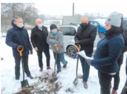
Burmistrz rozpoczyna budowę kanalizacji i oczyszczalni ścieków w Śląsinie str. 4