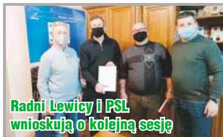
Radni Lewicy i PSL wnoszą o kolejną sesję