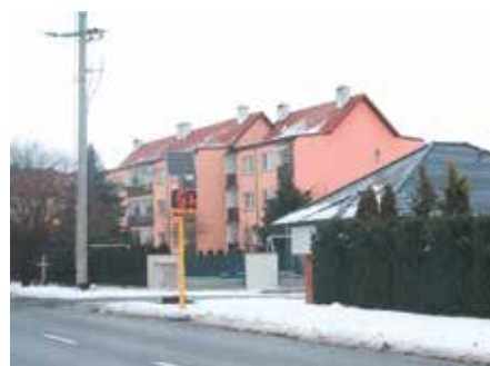
Wyświetlacze prędkości w Nowogardzie str. 6