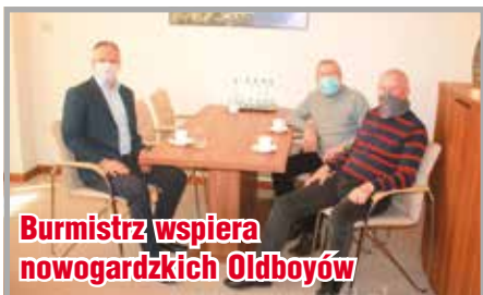
Burmistrz wspiera nowogardzkich Oldboyów