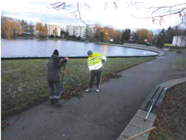
Grabienie skwerków - Przystań

Od ponad dziesięciu lat, z inicjatywy Burmistrza Roberta Czapli, trwa systematyczne porządkowanie naszej gminy. Prace wykonywane są przez stażystów Urzędu Miejskiego, pracowników interwencyjnych z Urzędu Pracy. W ostatnim czasie wykonano: