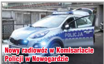
Nowy radiowóz w Komisariacie Policji w Nowogardzie