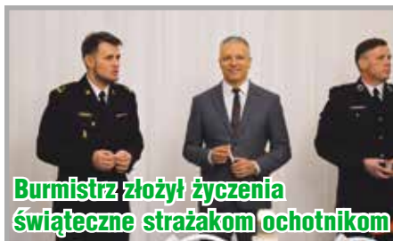
Burmistrz złożył życzenia świąteczne strażakom ochotnikom