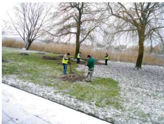
Zieleniec ścieżka, parking zielona