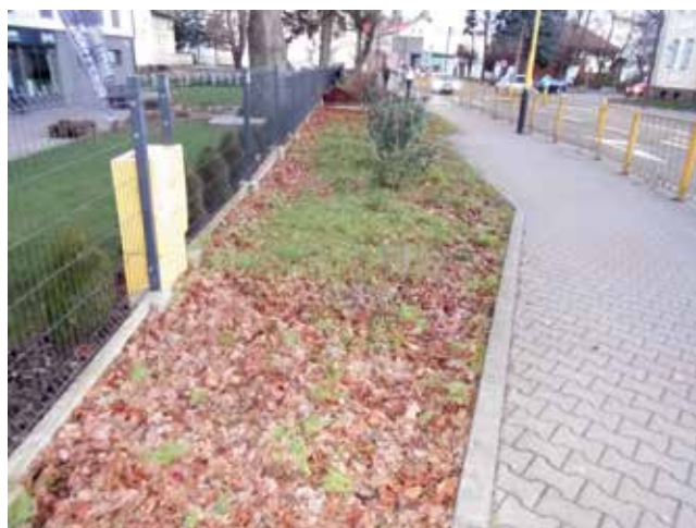
Zieleniec - ul. 3 maja