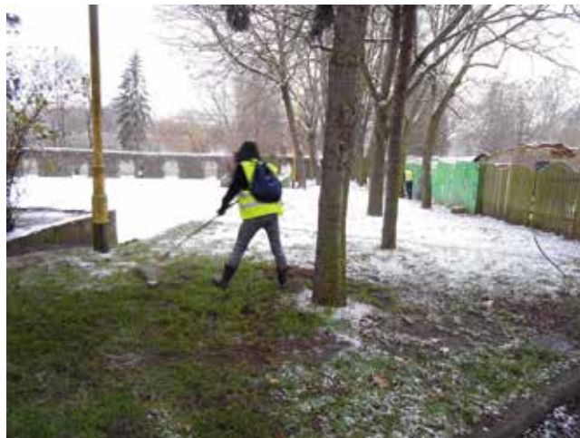
Zieleniec - NDK