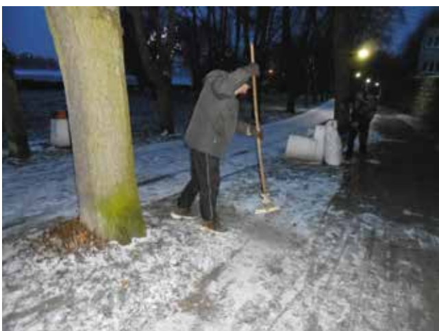
Prace porządkowe pod murami