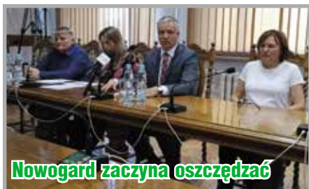
Nowogard zaczyna oszczędzać