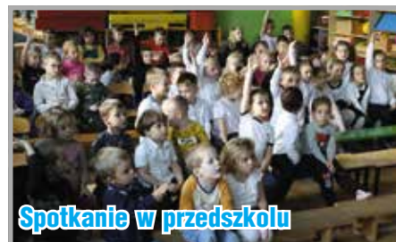
Spotkanie w przedszkolu