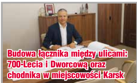
Budowa łącznika między ulicami: 700-Lecia i Dworcową oraz chodnika w miejscowości Karsk